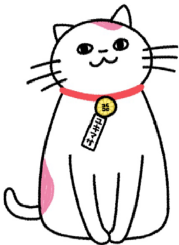
全国行政書士会 公式キャラクター 「ユキマサくん」

1 行政書士は、他人の依頼を受け報酬を得て、以下に掲げる事務を業とすることとされています。ただし、その業務を行うことが他の法律において制限されているものについては、業務を行うことができません。（行政書士法第1条の2、第1条の3 行政書士の業務）