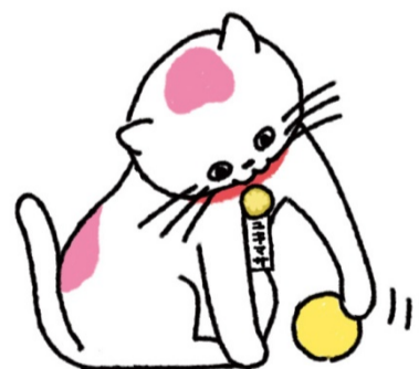
全国行政書士会 公式キャラクター 「ユキマサくん」